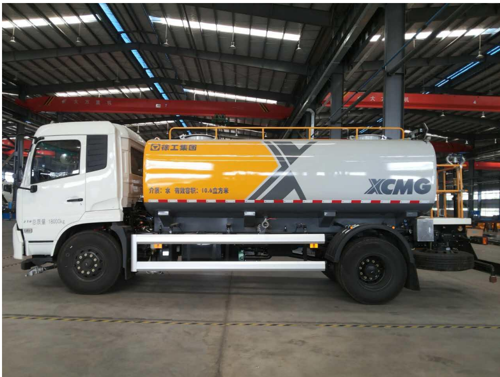
Малюнок 1.1 Машина для чищення марки Xugong XZJ5183GQXD5

Машина для прибирання XZJ5183GQXD5 має незалежну систему водопостачання високого та низького тиску. Вода під високим тиском може очистити дорожнє покриття, бордюр, тротуар та зону ізоляції огорожі; Пістолет-розпилювач високого тиску також може очищати дорожні знаки, рекламні щити та підйоми. Система розпилення забезпечує потужне розпилення, аерозольну дезінфекцію та регулювання вологості повітря. Систему водотоку низького тиску можна використовувати для поливу, пилю та озеленення.